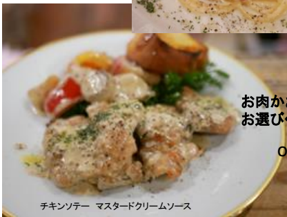
チキンステーキ マスタードクリームソース