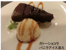
ガトーショコラ バニラアイス添え